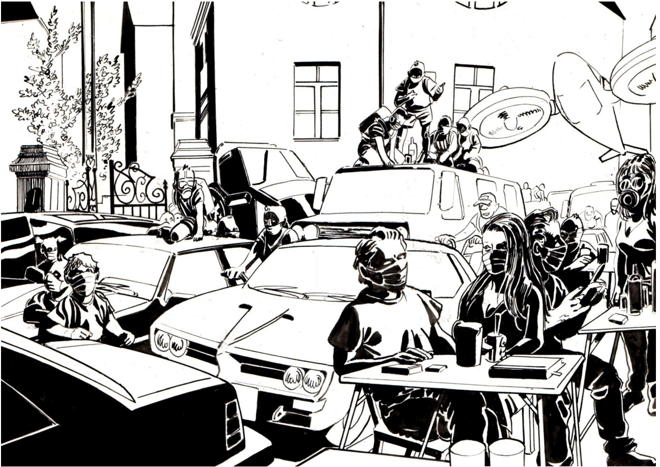
Ribisl-Grafik „Beispielbild Minoritenweg“ von Maximilian Meier