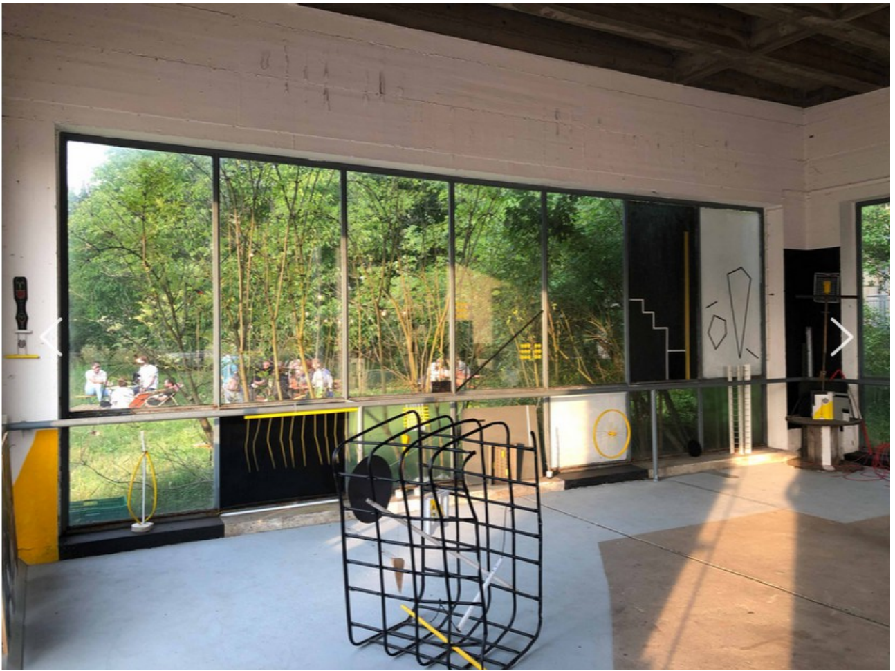
Nutzung durch den Kulturviertel Verein: https://bauwärts.de/prinzleokultur/