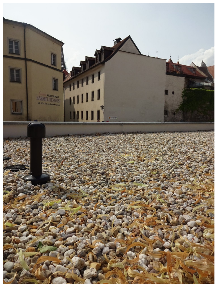
Dachöffnung- & Rohr / Hintergrund begrünte Fassade